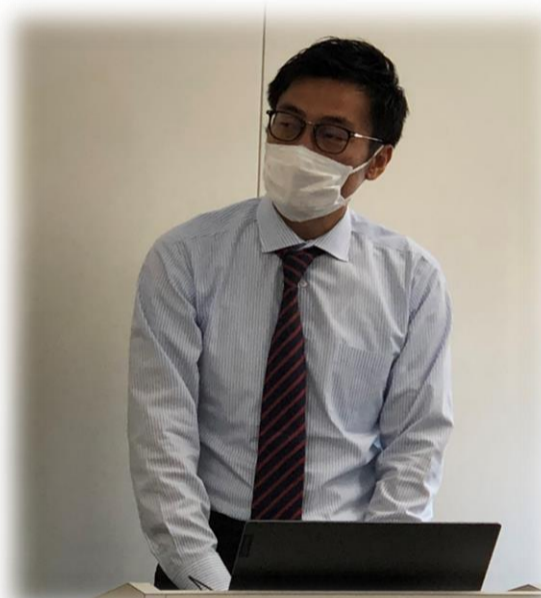
配車課・船坂課長