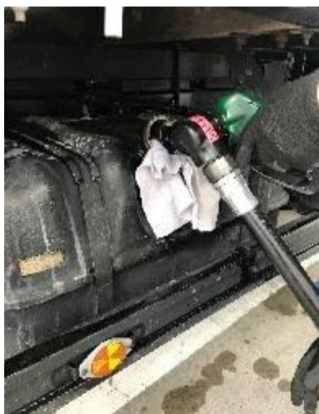
①奥までノズルを差し込み、吹きこぼし防止の為、給油口に必ずウエスを挟む。