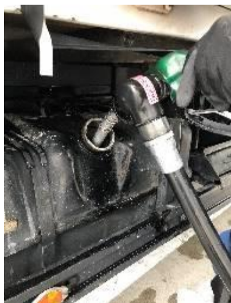
②自動停止後の追加給油はしないこと。給油後、ノズルをよく振り、軽油を残さない。