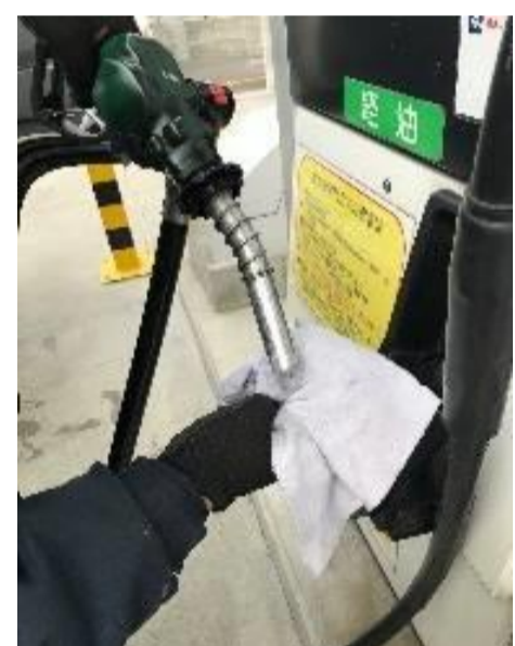
③給油ノズルを戻す際に、ノズル内に残った軽油をウエスに出し切ってください。