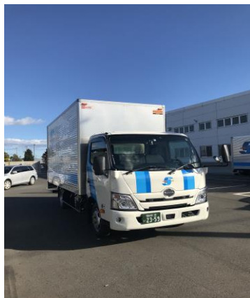
新車購入(2tW) 尾張小牧130い2359 (令和3年12月13日納車)