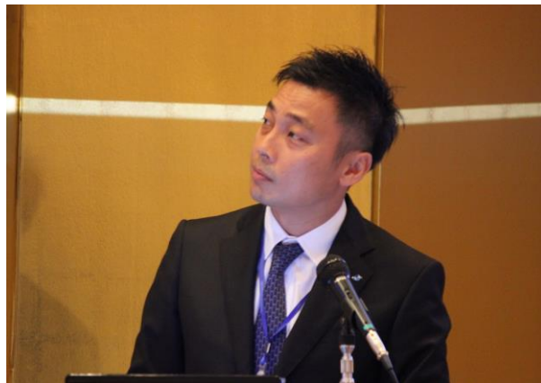
表彰風景・懇親会風景は裏面参照