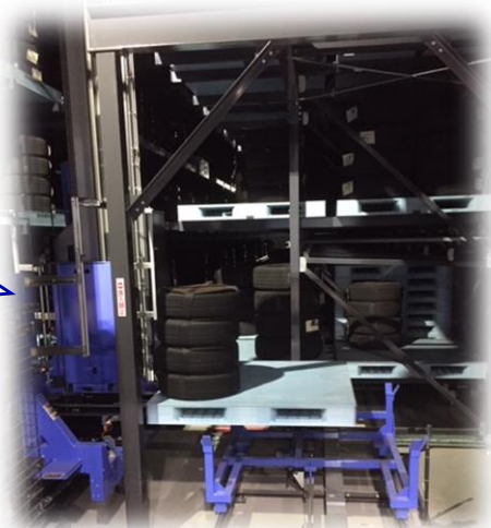
タイヤを倉庫内に入れ、格納するレールレールに収める場所。