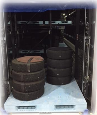
自動倉庫よりタイヤを出庫しているところ。

シーズン当初よりタイヤ事業も順調なスタートをきることができ、預かり本数も増える傾向にあります。これもひとえに既存ユーザー様のご支援と新規ユーザー様からの協力によるものであり、大変感謝しております。今後もご期待に沿えるよう努力してまいりますので、引き続き当社をよろしくお願いいたします。