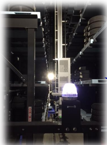
レールレールに乗ったタイヤを、倉庫奥に格納中。