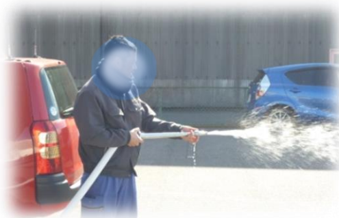
消火栓での放水体験