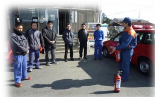
消火器取扱い説明受講